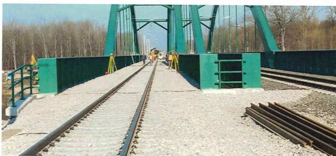
UČS 12, Záťažové skúšky