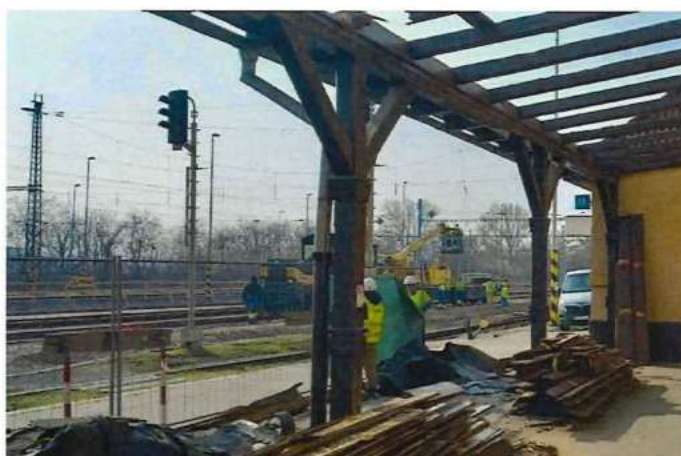
UČS 02 Zohor, demontáž prístrešku