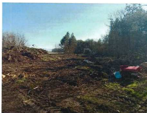
UČS 02 – Výruby