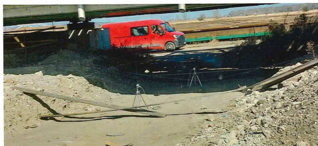
UČS 12, Závažové skúšky