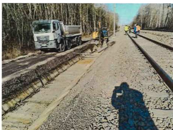
UČS 10, Výkop priekop