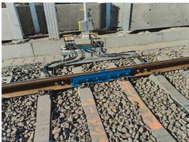
UČS 10-12, Montáž LIS