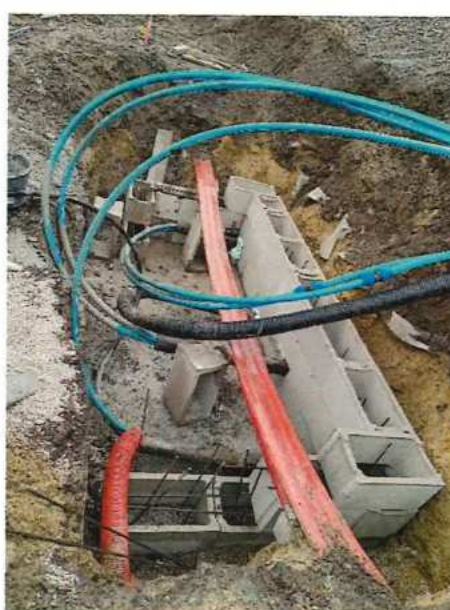
UČS 12 Zriadenie šachty pri pretlakoch