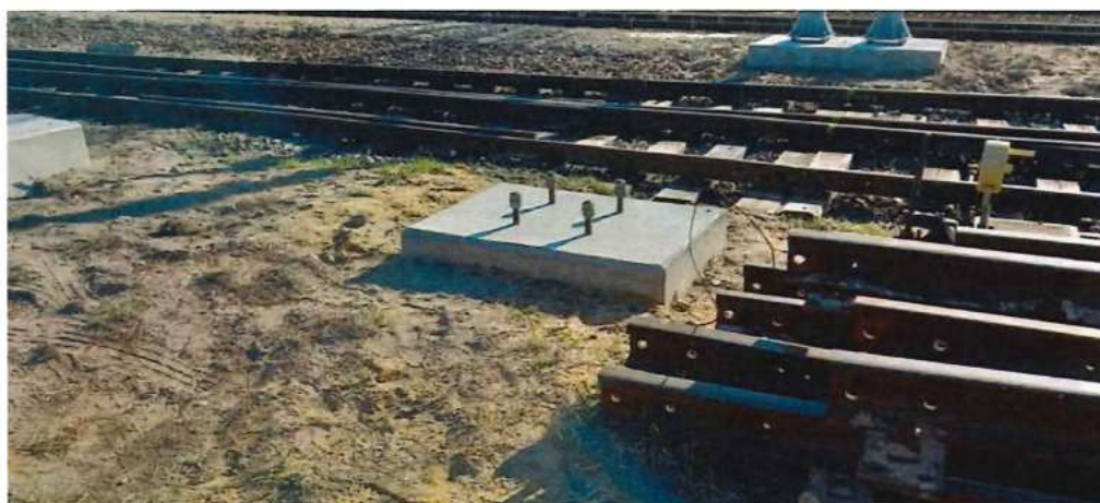
UČS 02, Zohor – Betonáž základov TP