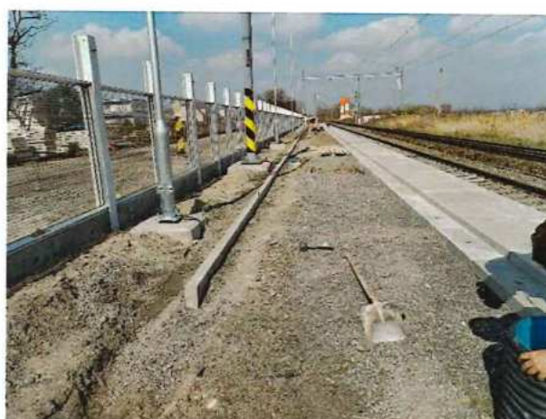
UČS 11 Nástupisko – pokládka obrubníků