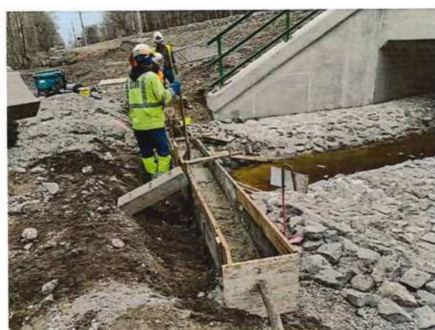
UČS 10 Betonáž čela odtoku