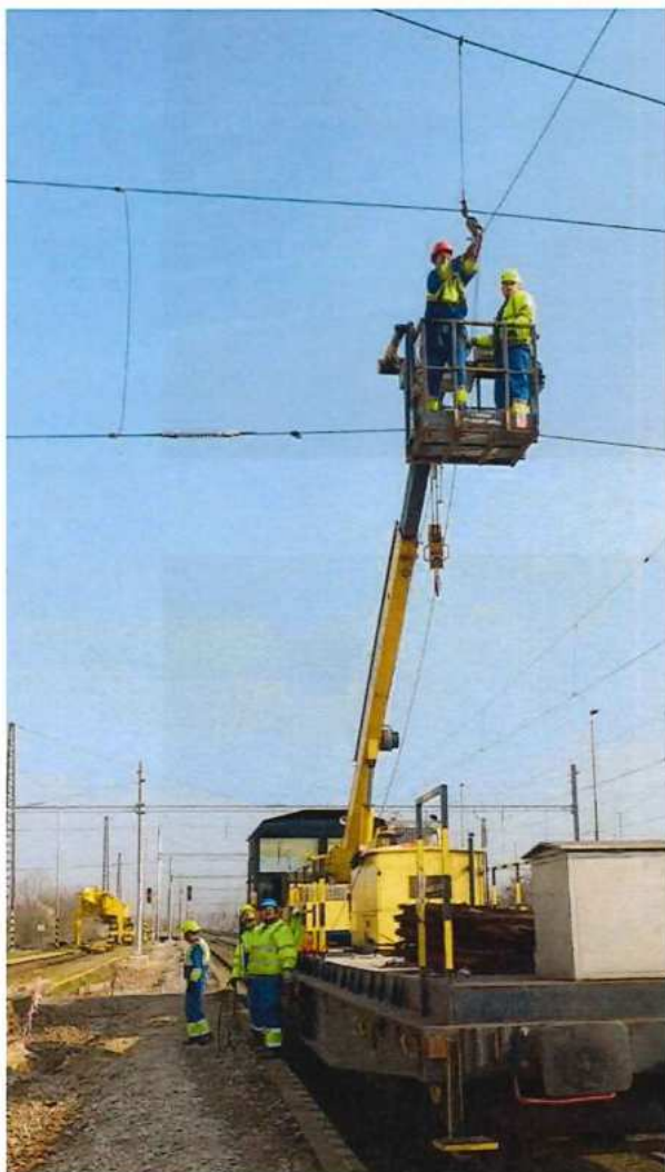
UČS 02 ŽST Zohor – demontáž TV