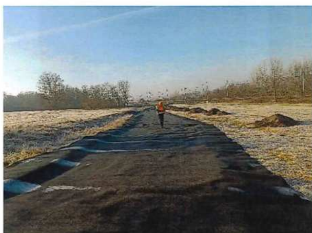
UČS 01 Prístupové komunikácie