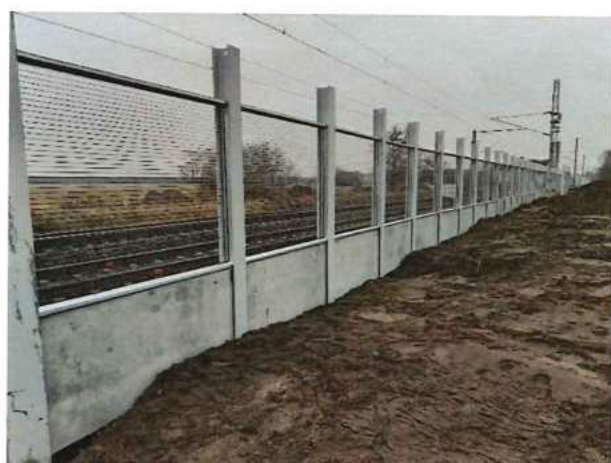
UČS 10, 11 – Montáž panelov PHS