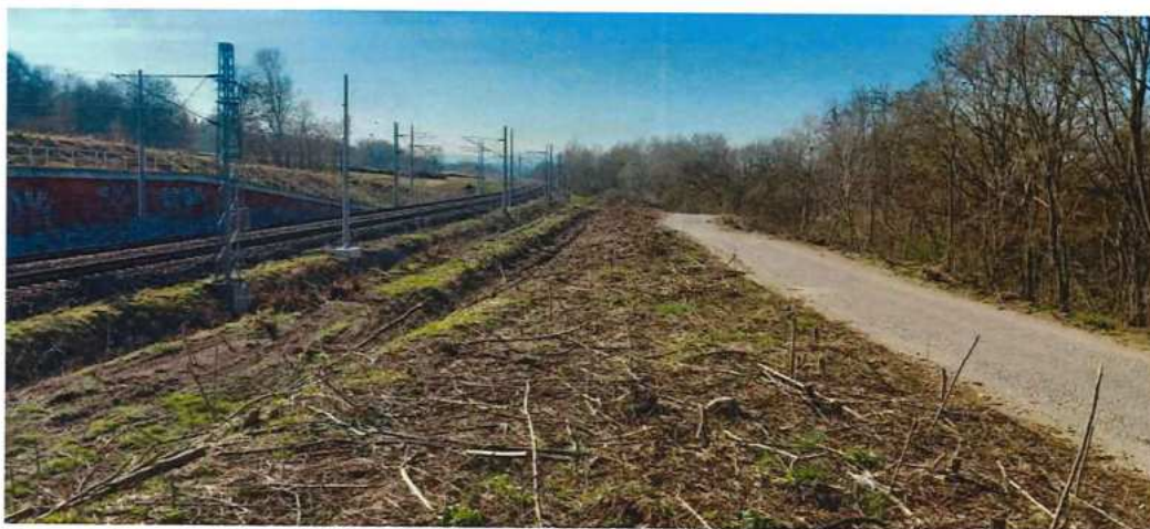
UČS 01, Výruby