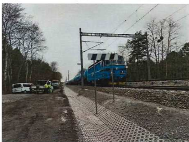
UČS 10, Budovanie priekop