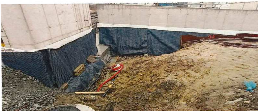
UČS 11 Izolovanie spodnej stavby