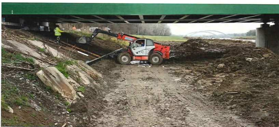
UČS 12 Obloženie svahov kameňom