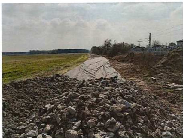
UČS 11 Prístupové komunikácie