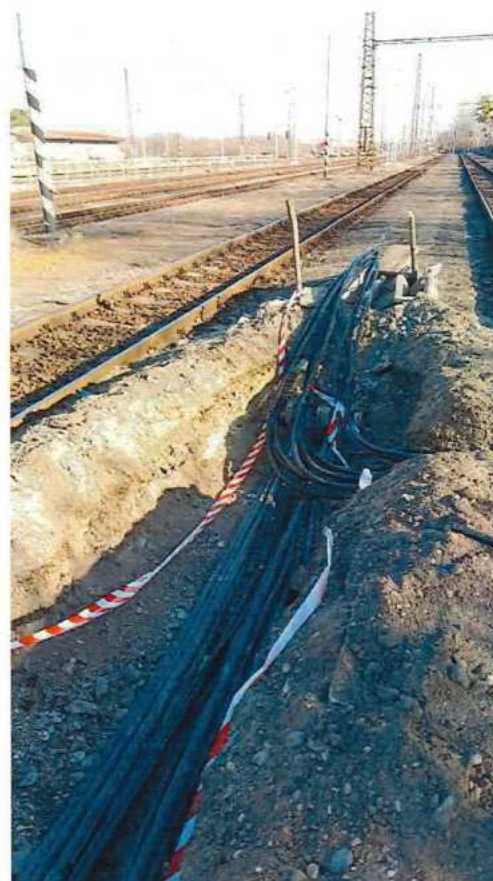
UČS 02, Pokládka káblov, pretlak