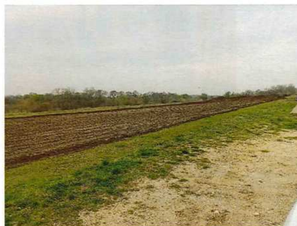
UČS 01 Odhumusovanie