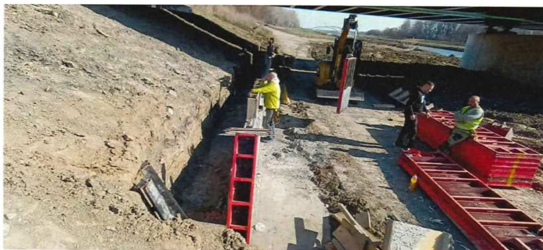
UČS 12 Budovanie múrikov