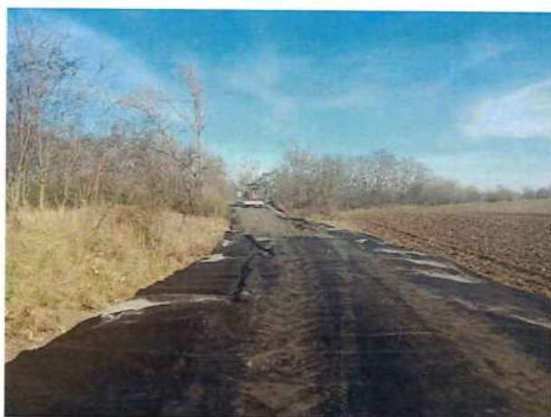
UČS 01 – Budovanie prístupových ciest