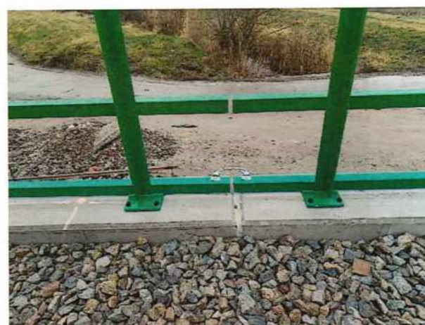
UČS 12 Vodivé prepojenie zábradlí a ukofajnenie