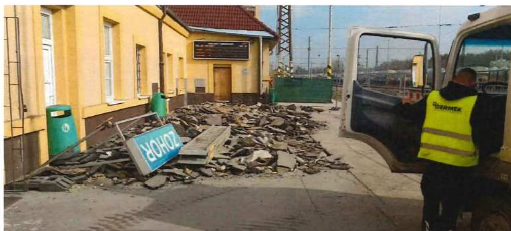
UČS 02, Zohor, búranie spevnených plôch